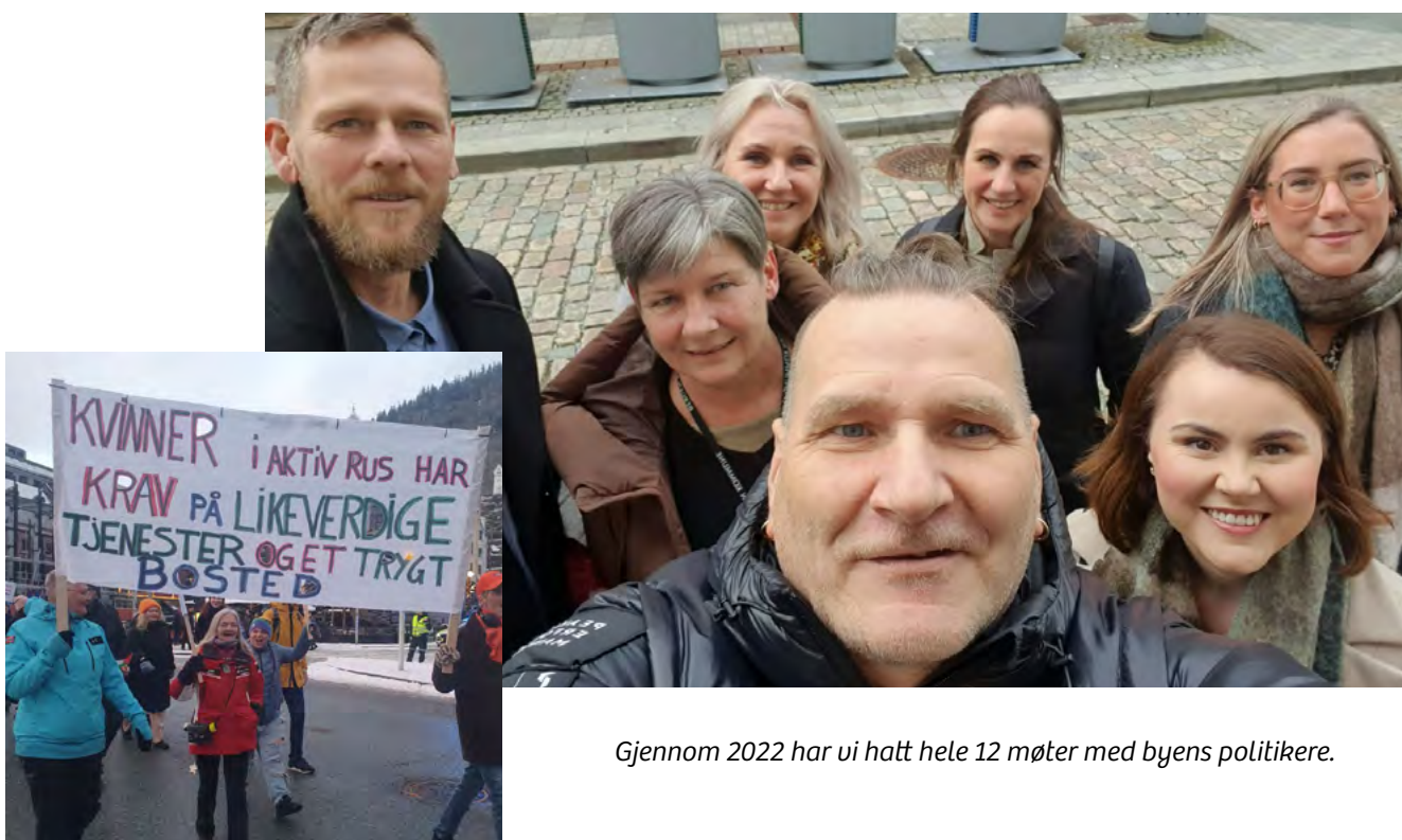
Gjennom 2022 har vi hatt hele 12 møter med byens politikere.

Vi vil arbeide iherdig for at Huset Bergen sin visjon om skadereduksjon, inkludering og medborgerskap ikke bare blir ord – men uises i handling og i resultater.