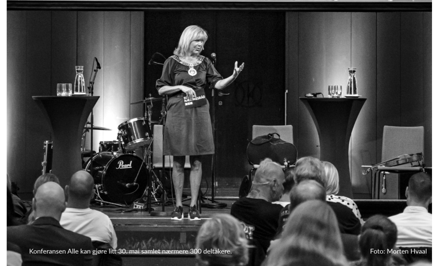
Konferansen Alle kan gjøre litt 30. mai samlet nærmere 300 deltakere.